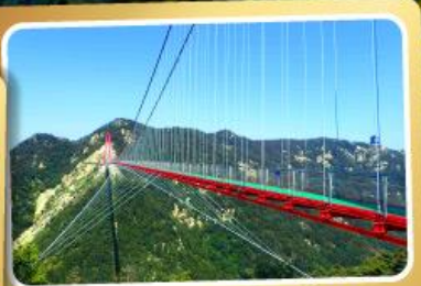
สะพานแวนอ้ายจ้าย