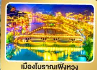
เมืองโบราณเฟิงหวง